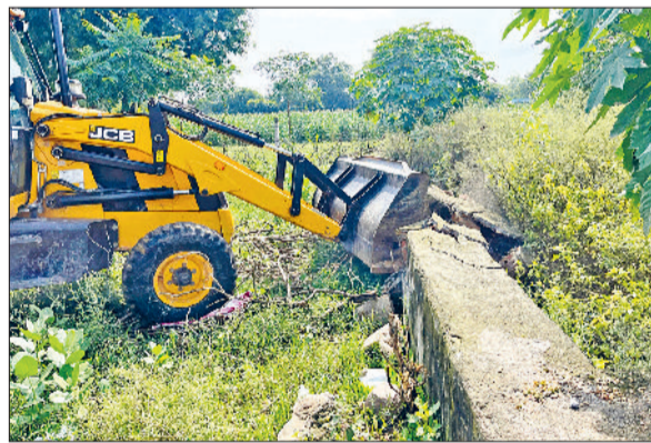
नारनौल। अवैध निर्माण ध्वस्त करती जेसीबी।