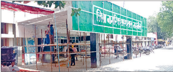
नारनौल। जिला नागरिक अस्पताल।

उल्लेखनीय है कि यह पहल राज्य के मुख्यमंत्री ने बजट घोषणा को पूरा करने की दिशा में हाल ही में आयोजित प्रदेश स्तरीय मीटिंग में एक अहम कदम उठाया है, जिसके तहत प्रत्येक जिले में सरकारी अस्पतालों को नामी प्राइवेट अस्पतालों की तरह सुसज्जित किया जाएगा। प्रथम चरण में जिला स्तरीय नागरिक अस्पतालों को सुधारने का कार्य किया जाना है। यह दूरदर्शी प्रयास सिविल अस्पतालों के बुनियादी ढांचे के नवीनीकरण पर केंद्रित है, जिसमें शौचालय की मरम्मत से