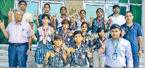
नारनौल। प्रतियोगिता के विजेता प्रतिभागियों के साथ स्कूल स्टाफ सदस्य।