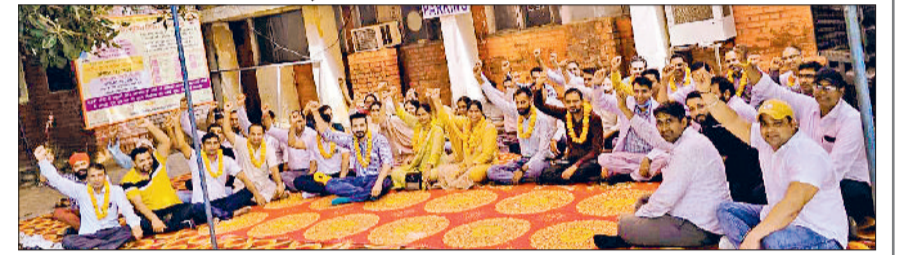
नारनौल। नागरिक अस्पताल गेट पर भूख हड़ताल पर बैठे स्वास्थ्य कर्मचारी।