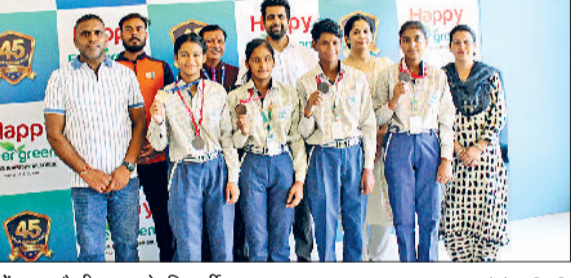
महेंद्रगढ़। हैप्पी स्कूल के विद्यार्थी व स्टाफ।