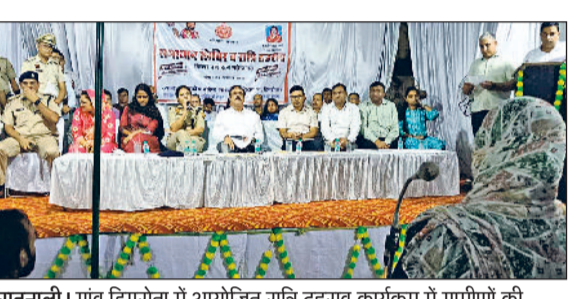
सतनाली। गांव डिगरोता में आयोजित रात्रि ठहराव कार्यक्रम में ग्रामीणों की शिकायत सुनते डीसी।

उपायुक्त ने कहा कि ग्रामीणों से सीधा संवाद कर उनकी हर समस्या का निवारण करना जिला प्रशासन की सर्वोच्च प्राथमिकता है। हरिभूमि न्यूज ▶▶ सतनाली मंडी