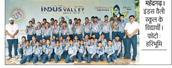
महेंद्रगढ़। इंडस वैली स्कूल के विद्यार्थी।