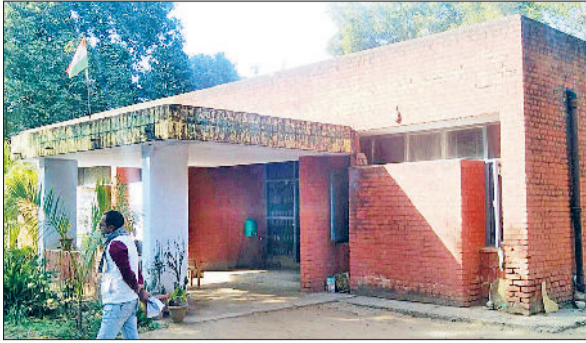
महेन्द्रगढ़। कृषि विभाग कार्यालय।

खास बातें महेन्द्रगढ़ जिले के किसान प्रदेश में है आठवें स्थान पर, जिले के 92346 किसानों ने कराया है 285788 हेक्टेयर फसल का पंजीकरण सिरसा जिले के किसान पंजीकरण कराने में है पहले स्थान पर, सिरसा में 148388 ने कराया है 696386 हेक्टेयर फसल का पंजीकरण